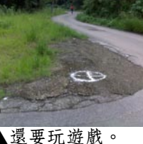
▲前方很多岔路，兔子特別做一個⊗玩玩。