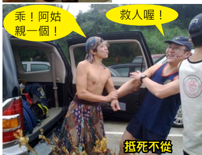
Five Hundred One