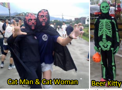
Cat Man & Cat Woman Beer Kitty