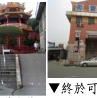
▲從鶯歌車站的前門進，後門出。