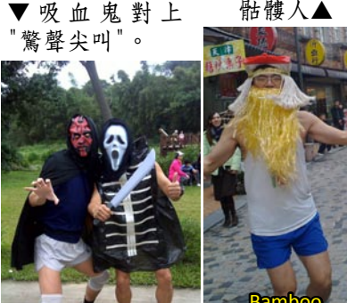
Cat Man & U.K. Bamboo