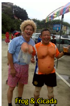
Frog & Cicada