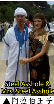
Steel Asshole & Mrs. Steel Asshole