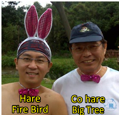
萬聖節的主角是各路的妖魔鬼怪，猜得到他們是誰嗎？