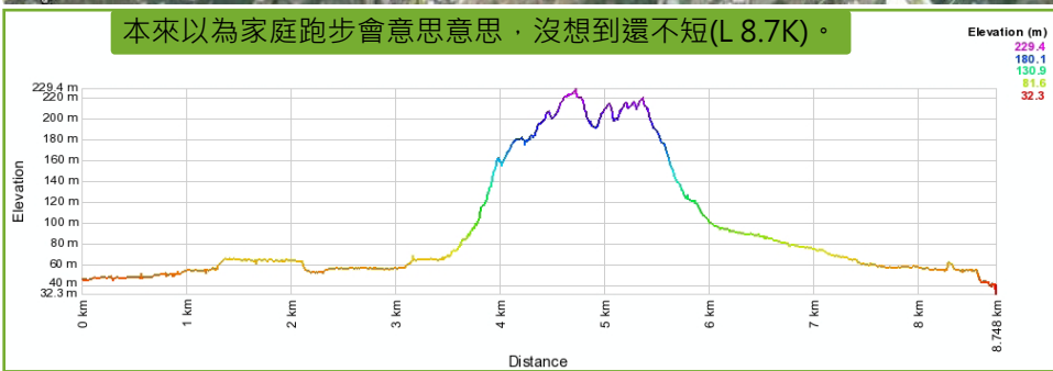
本來以為家庭跑步會意思意思，沒想到還不短(L 8.7K)。