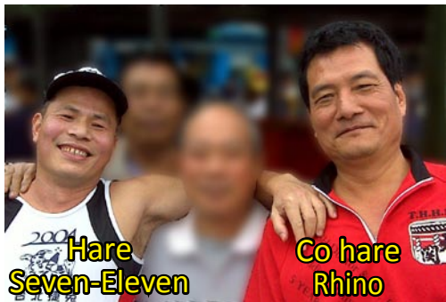
Hare Seven-Eleven Co hare Rhino

▲Bamboo用來拍兔崽子的相機，是高科技產物的結晶，價值不菲，會自動辨識正副兔子，非相關人員想要搶鏡頭都會自動失焦。