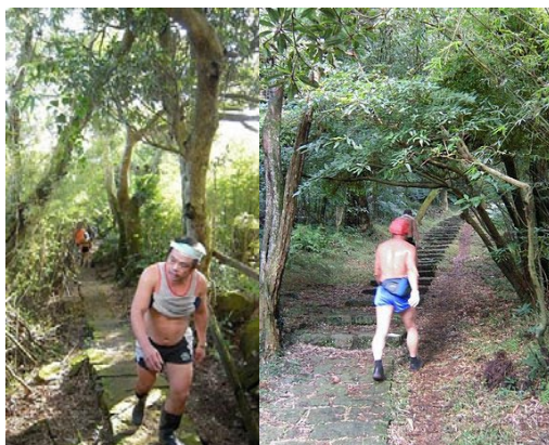
▼Boots 我可是有備而來的,下雨吧! 蝦米攏毋驚!