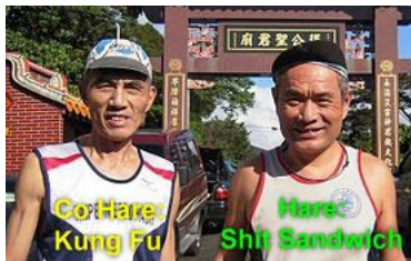
也許是天氣不錯,許多好久不見的兔崽子,今天又出現了, Laughing Gas, Point, Voodoo...

TOOL(涂平亞)的『Hash座右銘』 --每天默念百次,永保年輕 "我們不是因為年老而停止玩樂,我們是因為停止玩樂而年老"