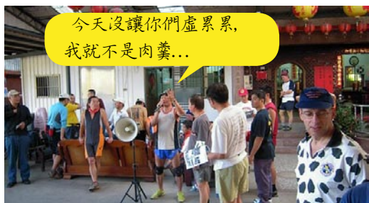
今天沒讓你們虛累累,我就不是肉羹...

TOOL(涂平亞)的『Hash座右銘』 --每天默念百次,永保年輕 "我們不是因為年老而停止玩樂,我們是因為停止玩樂而年老"