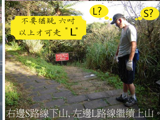
右邊S路線下山, 左邊L路線繼續上山。