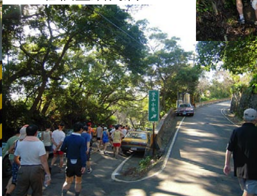
▲右邊登山路上中正山, 路線左下之後也是要直線貫穿馬路上中正山。 ▼右邊可上中正山頂, 路線往左去。