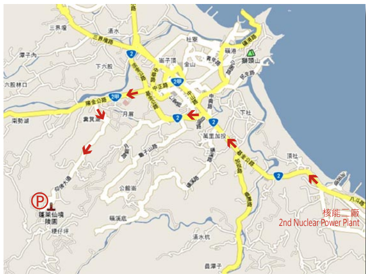
▲Guide map of 1935th Run on 23 Jan 2010 2010年1月23日1935次跑導圖