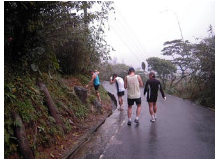
▲往下跑了1.5K之後, 終於要轉小徑上山。