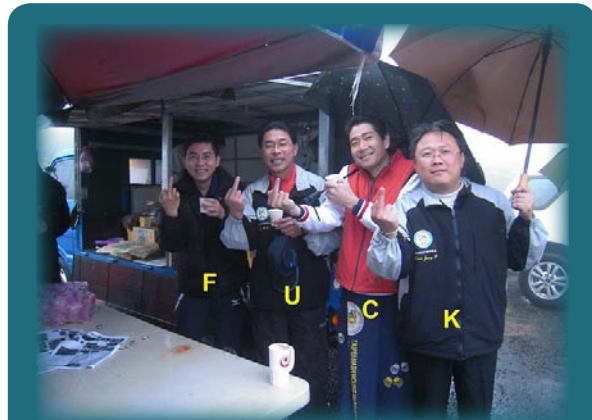
新成立的"幹"部四人團體竭誠為大家服務 依序為: Fire bird, Uk, Cat man, Kim jong il F.U.C.K.四人組, 簡稱 F4, 就是Ff... 到你死...