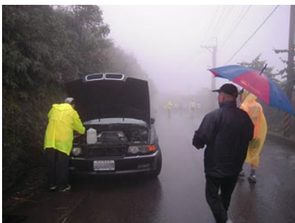
▲天候因素, 臨時決定14:35提前起跑。循來時路下山, 拋錨路邊Weaver的"米漿"還沒搞定。

P.S: 兔子感謝兔友捧場, 感恩啦! 天雨路滑、氣溫又低不少兔友「當龜」了, 歹勢啦! 提醒兔友這種路滑地形, 二人同行卡安全呢, 笑話為證: 有一父親帶兒子去洗澡, 地很滑, 兒子將要滑倒時, 一把抓住父親的生殖器才沒倒下, 父親罵到, 他媽的, 幸虧和我來的, 要和你媽來, 非摔死你!