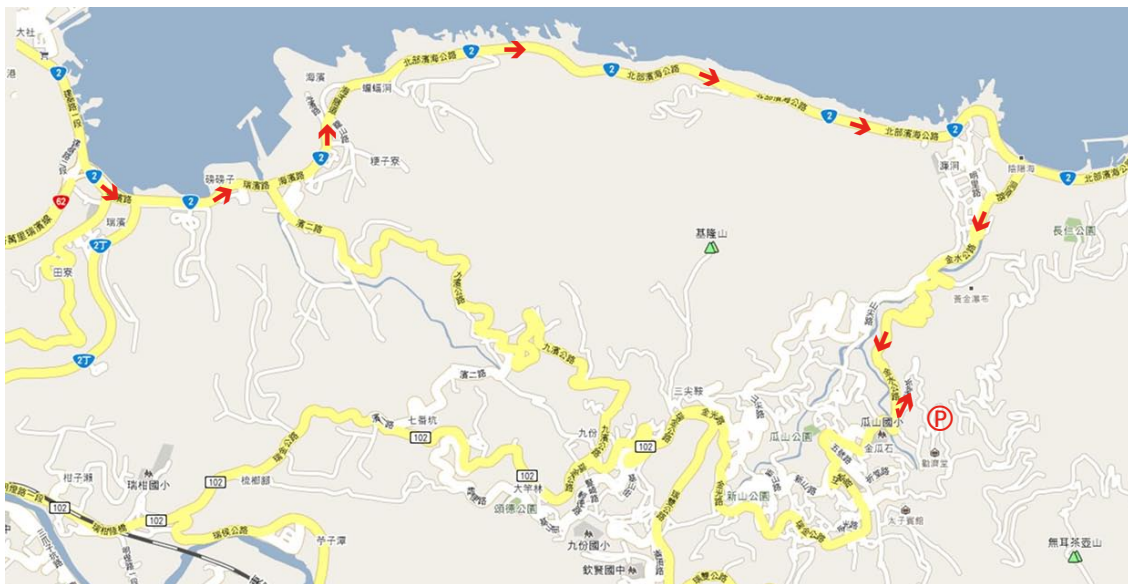
▲ Guide map of Run 1937 on 6 Feb 2010 2010年2月6日 1937次跑 導圖

一個九歲的小學生發現三年級的數學實在是他這一生中最難的功課,成績一直都不理想。在嘗試各式各樣的加強方法都無效後,父母在好友的建議下決定把孩子送去一所私立天主教學校。