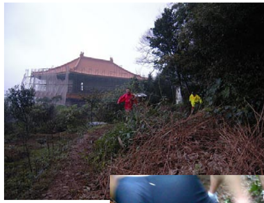
▲▶下雨天路徑超泥濘。