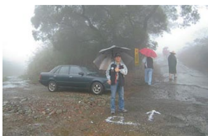
▲出發點就先做一個Check! 送分題。