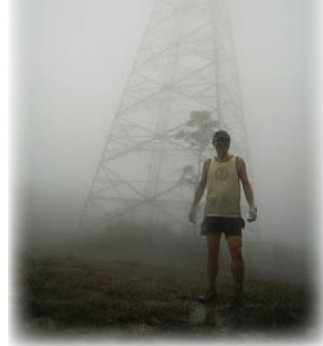
▲Multi-Service "招待" 永康來的朋友體驗什麼是捷兔。