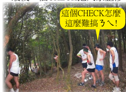
這個CHECK怎麼這麼難搞ㄟ！