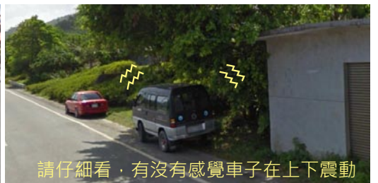
請仔細看, 有沒有感覺車子在上下震動