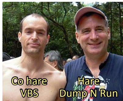
Co hare VBS