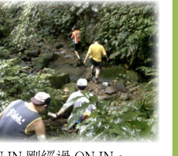
▼ON IN 剛經過 ON IN。