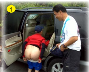
▲雖然是老屁股，比起SM Shit 的白屁屁絲毫不遜色。