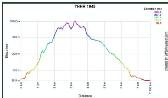
全長7.7公里，高低落差365米，還算有良心。

老猴當兔子，當然要規劃一條像老猴的路線，你看猴頭、頸、背、屁股、腳都有，連「猴爛 Monkey Dick」也考慮進來了！