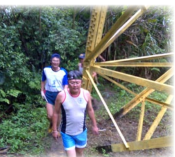
▲進入麻竹寮山步道。