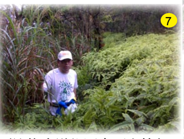
◀這條步道往回走可上筆架山，我們從這裡下溪谷。 ▶潦溪是一定要的啦! ▼古樸的農舍。