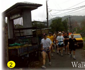
▼裝孝維的⊗，麵粉就在五米外的門檻上。