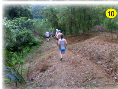
DOWN DOWN! DOWN DOWN!