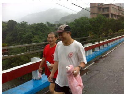
▲兔子出發了！麵粉袋是空的。