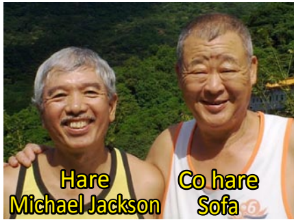
Hare Michael Jackson Co hare Sofa