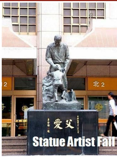
▲登在國外網站的照片，註解寫著：失敗的雕像藝術家。